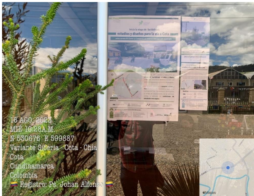
Fotografía 2. Verificación de los Puntos Satélites de información en el municipio de Cota.