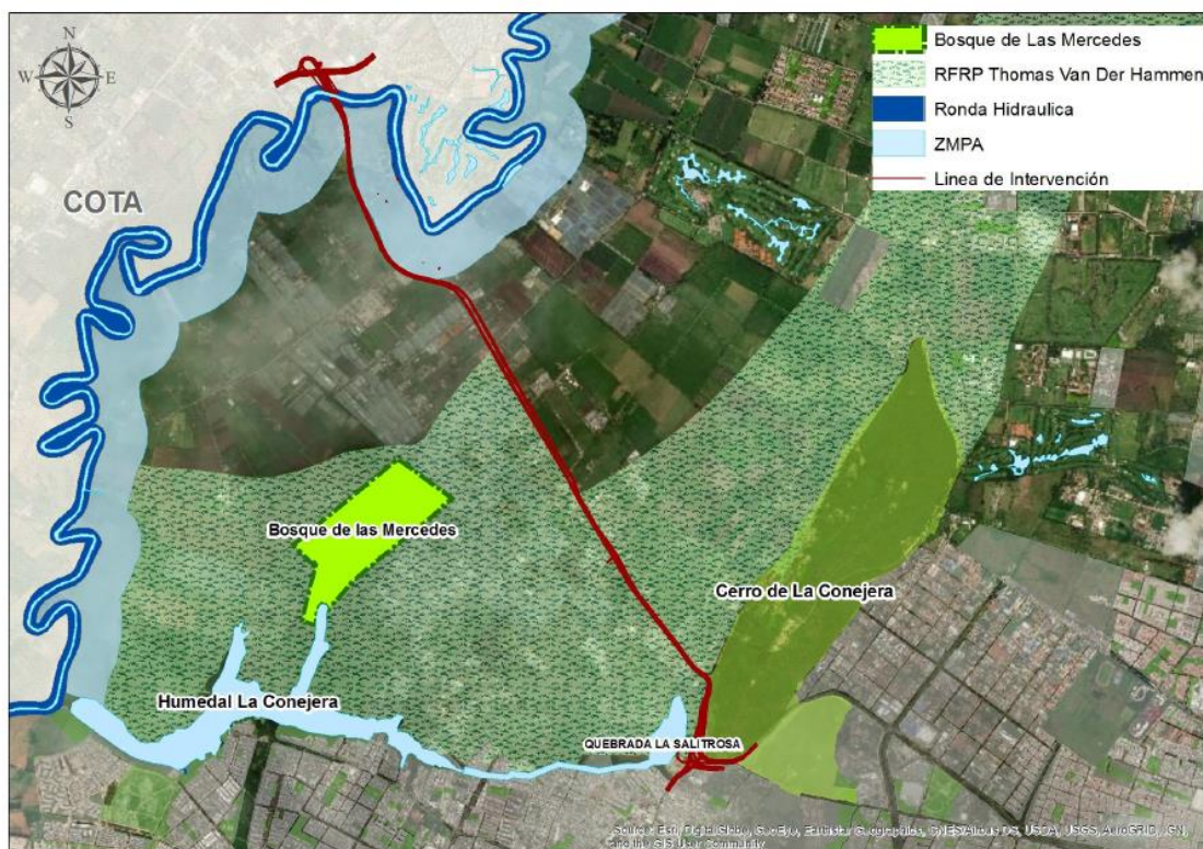
Ilustración 1. Trazada del proyecto con única alternativa.

De acuerdo con la etapa de prefactibilidad, el proyecto Vía Cota tiene una estimación en longitud de 5.7 kilómetros con único trazado como alternativa, busca que las calzadas, las aceras, las zonas de Bio Retención (SUDS) y las ciclorrutas planteadas para la Vía Cota, formen parte del nuevo sistema de espacio público, destinados al tránsito y permanencia de los peatones del sector; y se relacionan funcionalmente con elementos del espacio público construido, con los elementos de la estructura ecológica principal, con la red de ciclorrutas y con los senderos peatonales existentes.