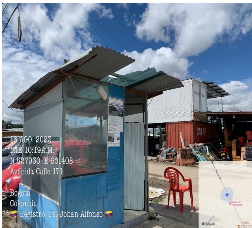
Fotografía 3. Verificación de los Puntos Satélites de información en la ciudad de Bogotá D.C.