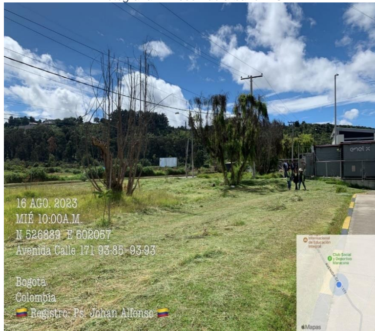
Fotografía 1. Recorrido urbano IDU.